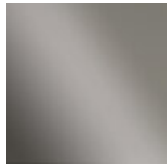
Black nichel Black nickel